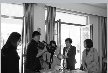
报道组 在运城复旦 小学采访。