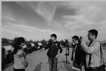
报道组 在大同火山 群地质公园 采访。