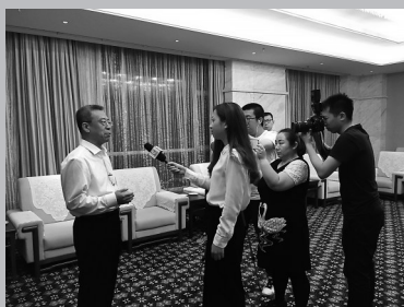
报道组 采访吕梁市 市委书记李 正印。