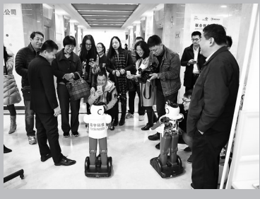
报道组 在太原高新 区参观机器 人。